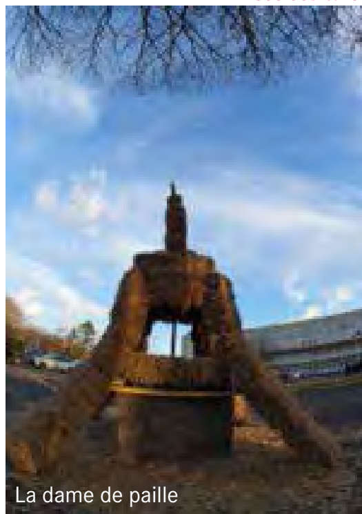
La dame de paille